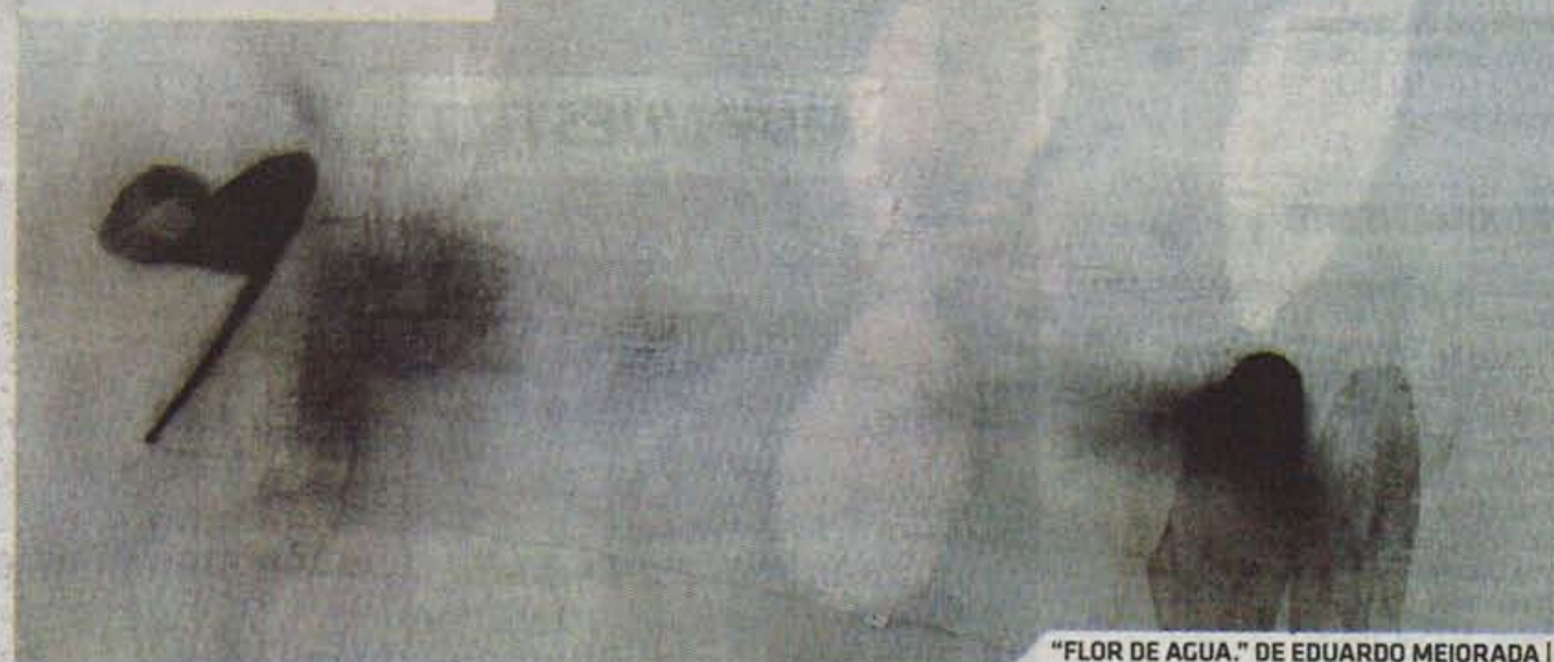
"FLOR DE AGUA." DE EDUARDO MEJORADA |